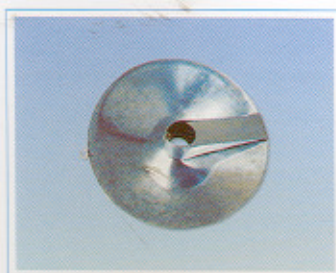
老鼠档 Mouse Resistance Appliance